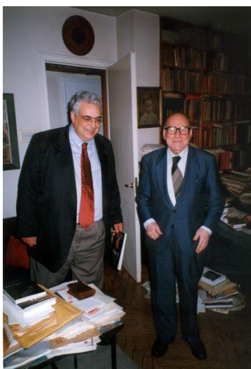
No apartamento de Julián Marías em Madri

Após gravarmos a entrevista, Don Julián convidou-me para assistir a suas conferências sobre filosofia (ele estava dando dois cursos de conferências). Anotei endereço, datas e fui ao curso “A Espanha possível do século XXI”. Ao chegar ao local (a conferência “ La moralidad colectiva ” era na calle San Bernardo, rua central em Madri), havia uma multidão, mais de 300 pessoas que se apinhavam para assistir a um filósofo, que contava, então, com 84 anos. Marías era um conferencista incomparável que, quase literalmente, tirava o ar da plateia. Sem nenhuma anotação, sua voz cálida, dava a impressão de estar conversando com cada um, semi-formalmente. Ao final, perguntei sobre a trabalhadeira da preparação e ele respondeu-me que não, que era tudo improvisado. E com o oxímoro: “ una improvisación inmensamente preparada! ”.