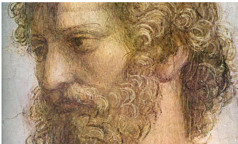
Aristóteles – detalhe de “A Escola de Atenas” de Rafael https://www.theguardian.com/books/2018/aug/09/aristotles-way-edith-hall-review

Ele foi, como sabem, e é uma coisa muito importante, mestre de Alexandre Magno. Mas, depois voltou a Atenas, passados muitos anos voltou a Atenas e fundou sua própria escola: o Liceu. Os senhores sabem que a tradição diz que ali se ensinava passeando, mestre e discípulos, por isso chamavam-nos peripatéticos, e chama-se Peripato à escola de Aristóteles.